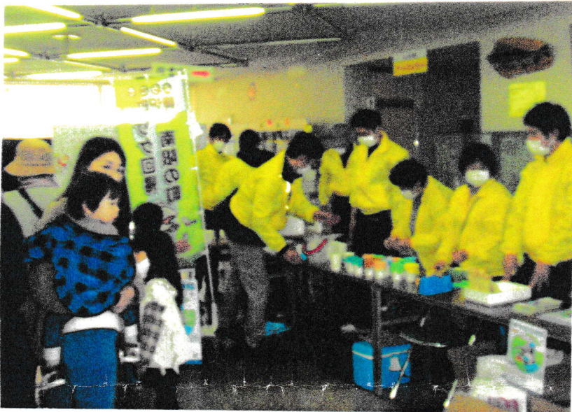
サケの受精卵の配布 会場：睦沢町公民館 2021, 12, 12