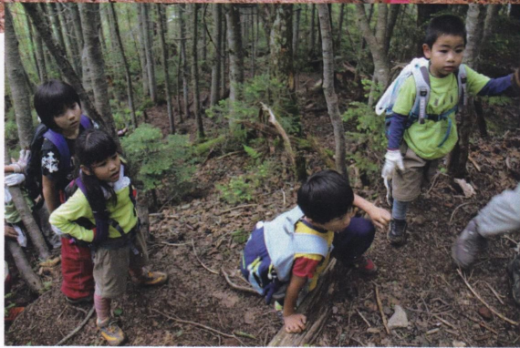
きつい登りでしたが子ども達もがんばりました。