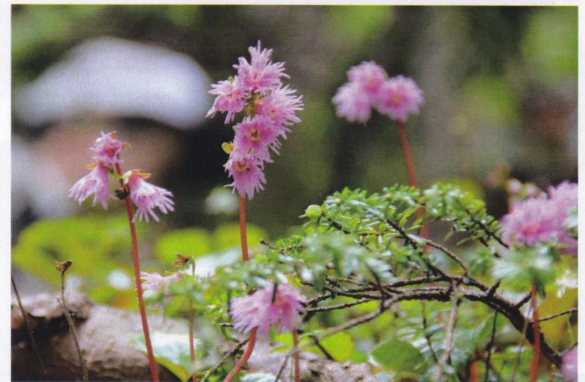
名も知らぬ可憐な花よ道すがら