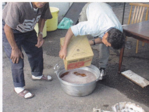
酢と砂糖のみで作られています。