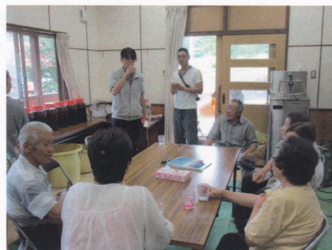
村の皆さんが集まったの試飲会

この紫蘇ジュースは米酢と砂糖、紫蘇の葉だけで作られています。常温で保存は出来ますが冷蔵庫に入れておけば尚安心です。