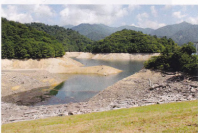
この時期、東京は水不足が心配されていました。ダムは底が見える程に渇水していました。