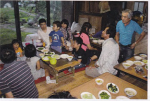
食卓には山のものが、皆さん喜んで食べました。