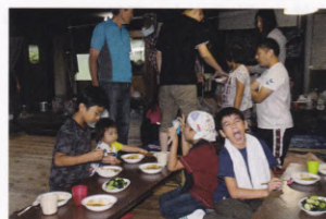
食事の後は花火をして楽しみました。