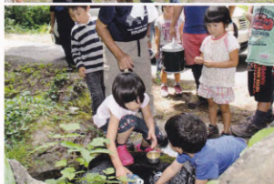
上野原は水がなく関ヶ原十王水を汲みました。