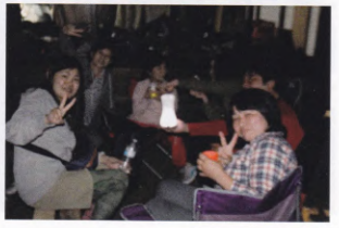
カメラのピントも合わなく成りました。