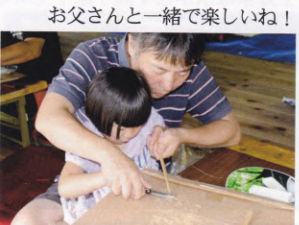
お父さんと一緒に楽しいね!