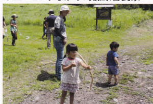
自然の中から矢になるものを探して、えい！や！