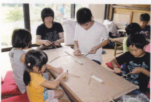
草木染めとマイ箸作りに挑戦