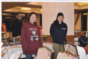
夕食のいただきますはお姐さん達です