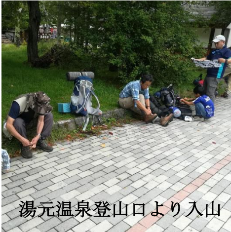
湯元温泉登山口より入山