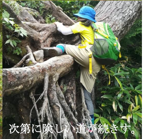
次第に険しい道が続きます。