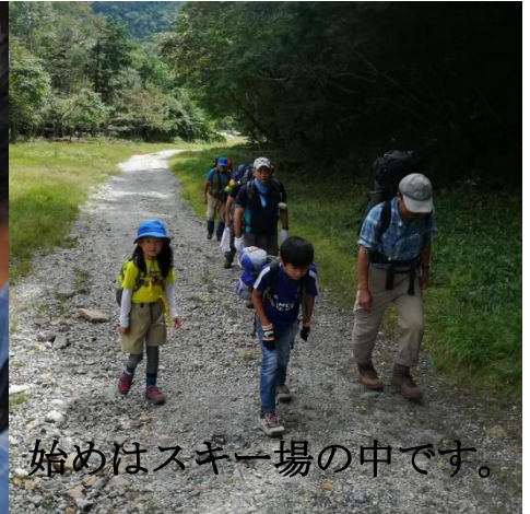
始めはスキー場の中す。