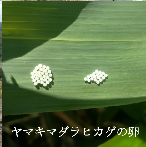
ヤマキマダラヒカゲの卵