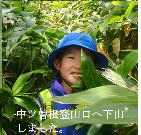
中ツ曾根登山口へ下山 しました。