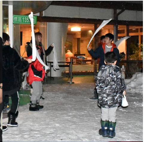
濡れタオルはカチカチ。