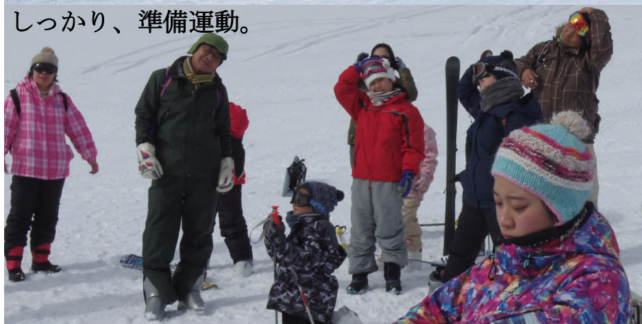
しっかり、準備運動。