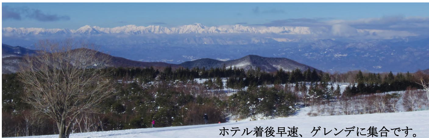
ホテル着後早速、ゲレンデに集合です。