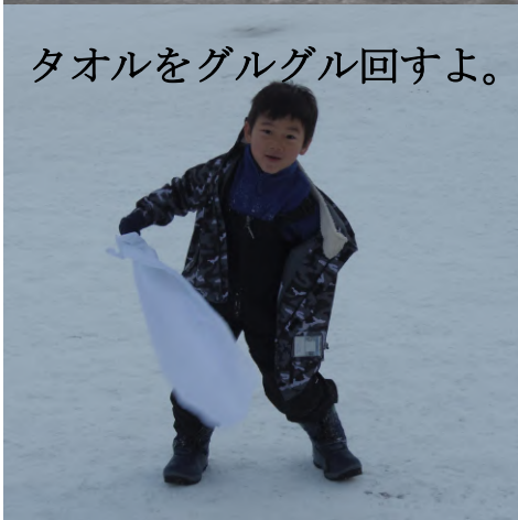
タオルをグルグル回すよ。