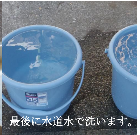
最後に水道水で洗います。