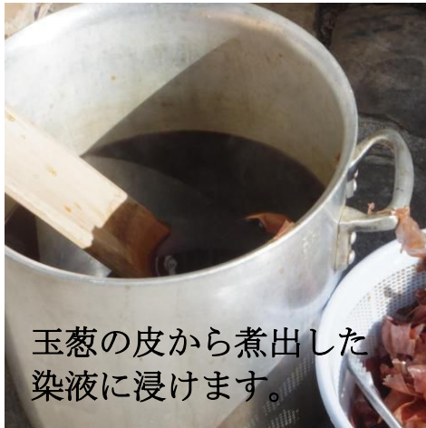
玉葱の皮から煮出した 染液に浸けます。