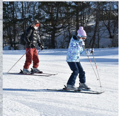
スキー指導員による講習