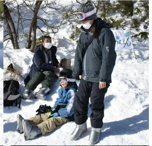
Café のらえもんは 軽食と情報交換の場 となりました。