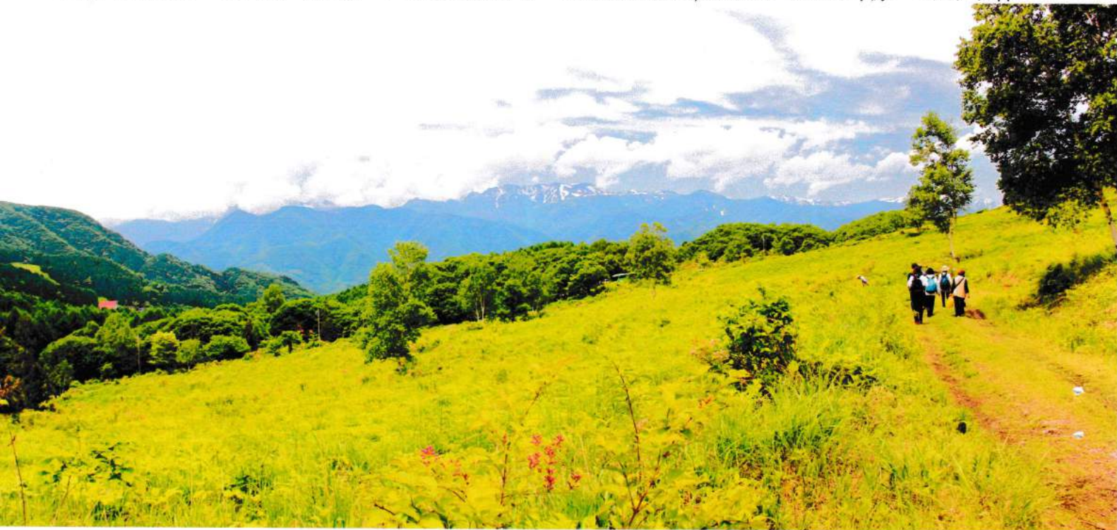
後方に残雪を残している山は朝日岳（標高 1945m）です。

面積・約 21ha 積雪量・約 2m 年平均気温 8.7℃ 年間降水量約 1,800mm ススキ草原 ミズナラ林