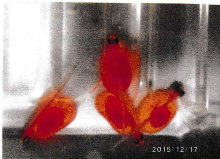
2015年12月12日 サケの受精卵16個育て始める