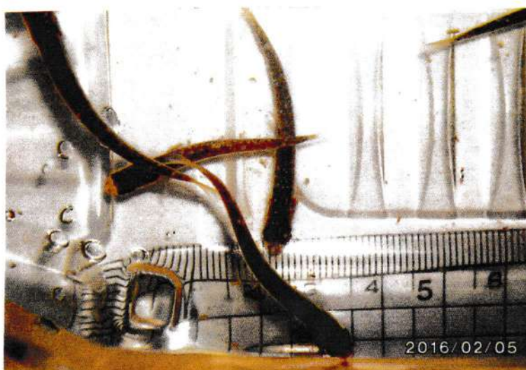
2016年 3月 5日 育った4匹の稚魚を放流する